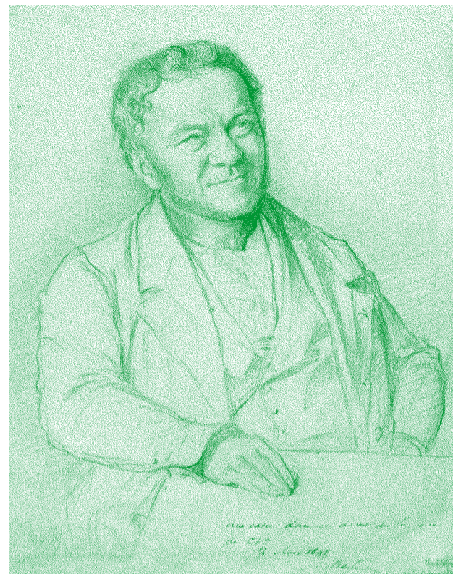
Henri Beyle, dit Stendhal

Où diable avais-je puisé cette idée? Du génie pour le métier de Molière et de Rousseau. Je méprisais sincèrement et souverainement le talent de Voltaire.